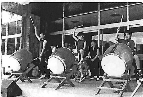
沢内小5年の2人（右側）がデビューを飾った さわうち太鼓百年座の復興への鼓動！