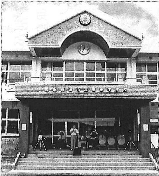
校庭の仮設住宅と向き合う横田中学校正面玄関は恰好の野外ステージとなった。