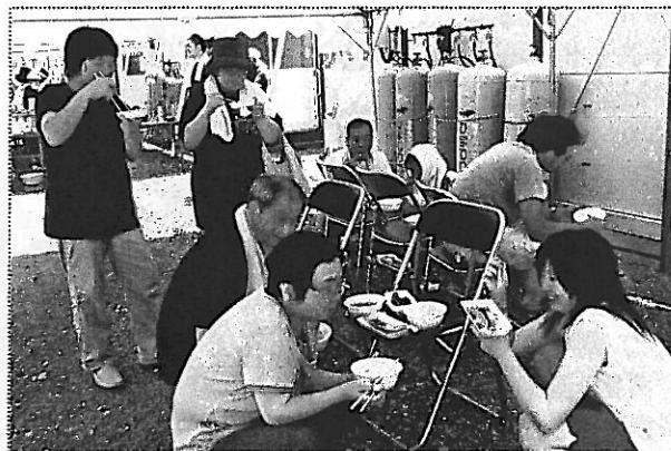
初対面が多い仮設住宅では絶好の交流機会！