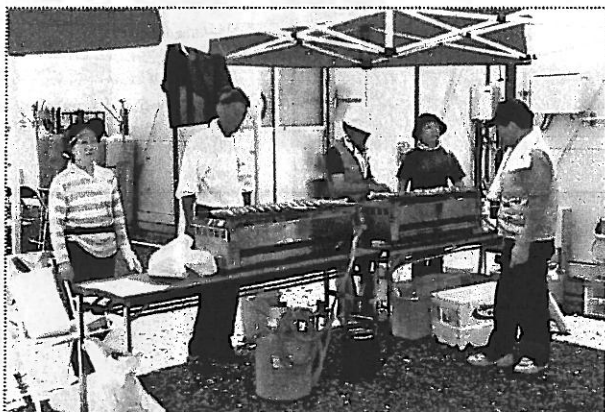
夢追い人かじか組合の岩魚の塩焼きコーナー