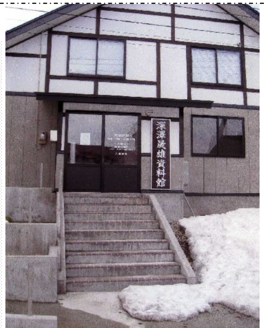
資料館の廻りの雪もだいぶとけてきました。春も近いです!(3月23日撮影)