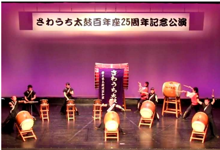
「いのちの鼓動」で会場を魅了した百年座のステージ