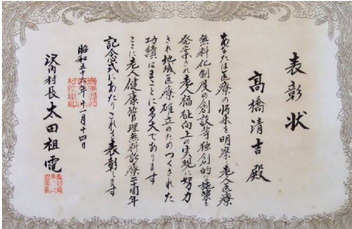
昭和56年の老人医療無料診療20周年記念式での表彰状