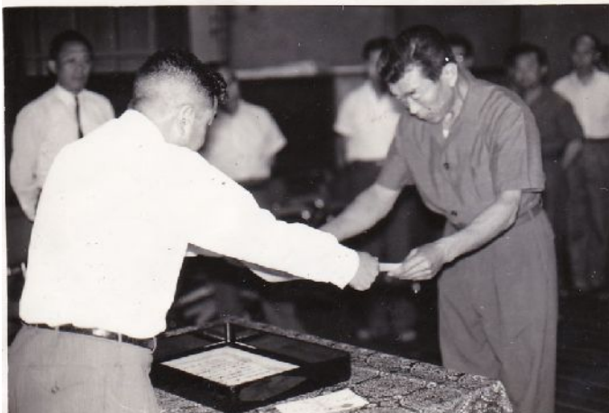
お目玉続きでも 褒められる機会は職員随一だった